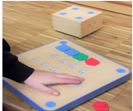
Cubetto.